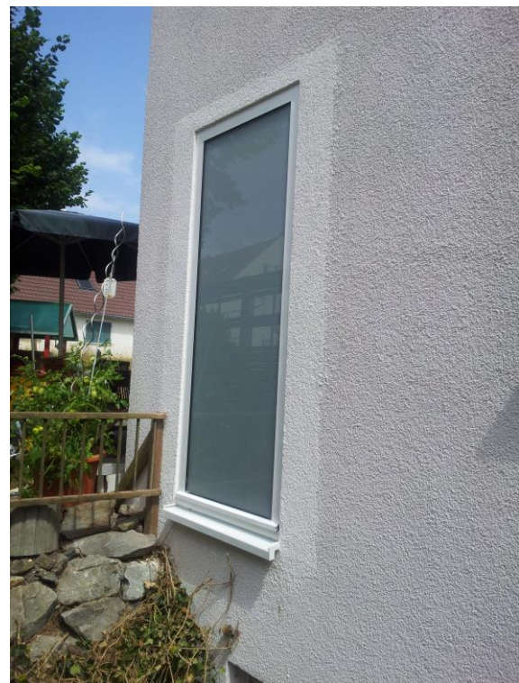
Solarkollektor eingebaut, Anstrich fehlt noch