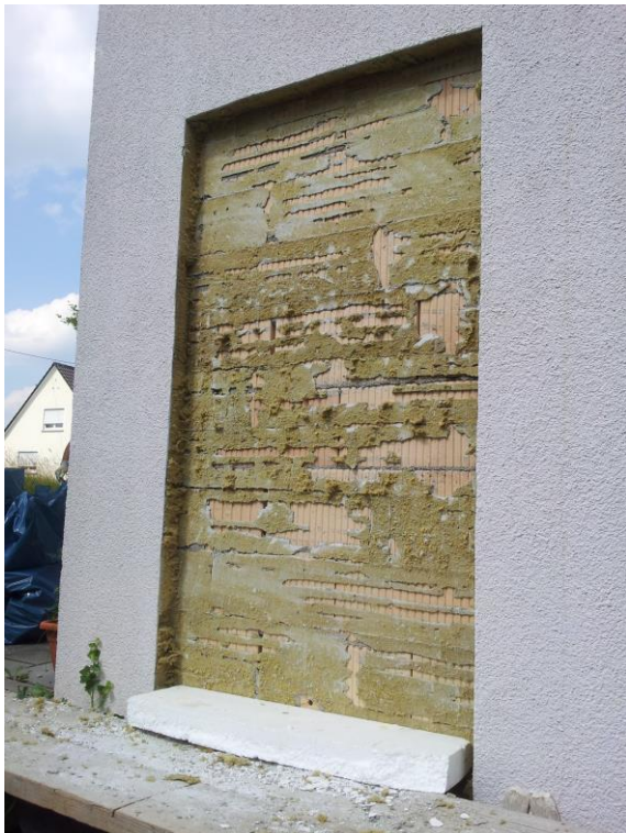
Öffnung in WDVS vorbereitet

Anbei die Bilder vom Einbau. Noch ist die Fassade nicht gestrichen, aber nach Abschluss der Arbeiten wird der Einbau nicht mehr erkennbar sein. Auch die Lüftungsspuren im Schlafzimmer oberhalb des Rolladenkasten gehören dann der Vergangenheit an und werden, da die Lüftung dann über den Wärmetauscher organisiert wird, nicht mehr auftreten.